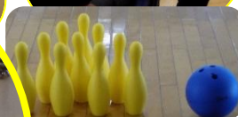
上位入賞者の方々、 おめでとうございます～

2月19日に麻雀大会を行いました。午前中からテイルームにこもり、長時間に渡り麻雀を楽しみました。昼食にはそれぞれ希望のお弁当の出前を頼み、食事もしました～♪（写真は、久慈グランドホテル様のナポリカツです！）