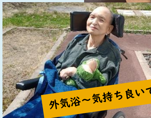
外気浴～気持ち良いですね