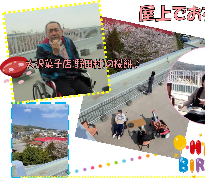
大沢菓子店(野田村)の桜餅♪

昨年ご好評いただいた、施設屋上からのお花見会を4月下旬に行いました。計5日間実施しましたが、ほとんどの日が天候に恵まれ、桜並木と久慈市内の景色を眺めました。5日間で行ったことで、桜の咲き始めを見た方、満開を見た方、葉桜を見た方といらっしゃいましたが、それぞれの桜の表情をご満喫頂けたかと思ひます。